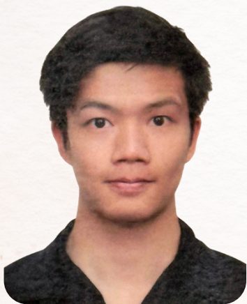
趙爾納 飾 漢成帝